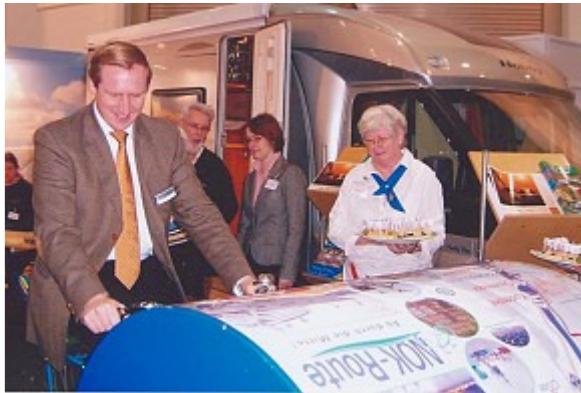
Landwirtschaftsminister von Bötticher am Stand der AktivRegion "Hügelland am Ostseestrand"

Landfrauen der Ortsvereine des Kreises Rendsburg-Eckernförde bei der Präsentation von Käse aus der Käserei Holtsee, Kieler Sprotten und Bonbons von der Bonbonkocherei Eckernförde.